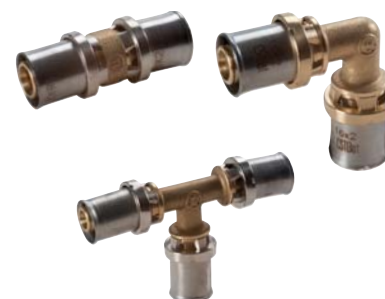
Пресс фитинги серии RM

Рабочая температура: 5÷110°C; Максимальное рабочее давление: 10 бар.