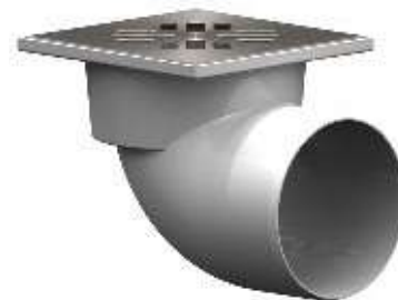
Табл. 6 Технические данные трапов типа ТП-105.110

ТП-105.110-150HSHs Трап горизонтальный D110 решетка нерж. сталь, 150x150 Максимальная нагрузка до 300 кг ТП-105.110-150HPHs Трап горизонтальный D110 с чугунной решеткой 150x150 Максимальная нагрузка до 1,5 тонн ТП-105.110-150HSDs Трап горизонтальный D110 решетка нерж. сталь, 150x150. «Сухой» затвор. Максимальная нагрузка до 300 кг ТП-105.110-150HPDs Трап горизонтальный D110 с чугунной решеткой 150x150. «Сухой» затвор. Максимальная нагрузка до 1,5 тонн