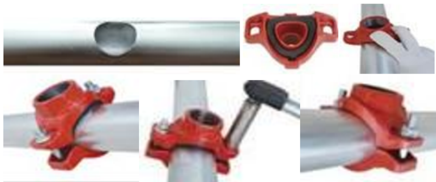
Рис.3. Установка отвода (седелка) под резьбу на трубопровод.