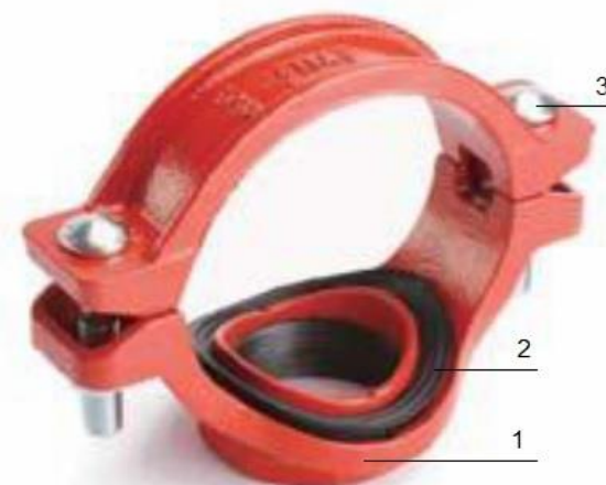
Рис.2. Отвод (седелка) под резьбу «LEDE».